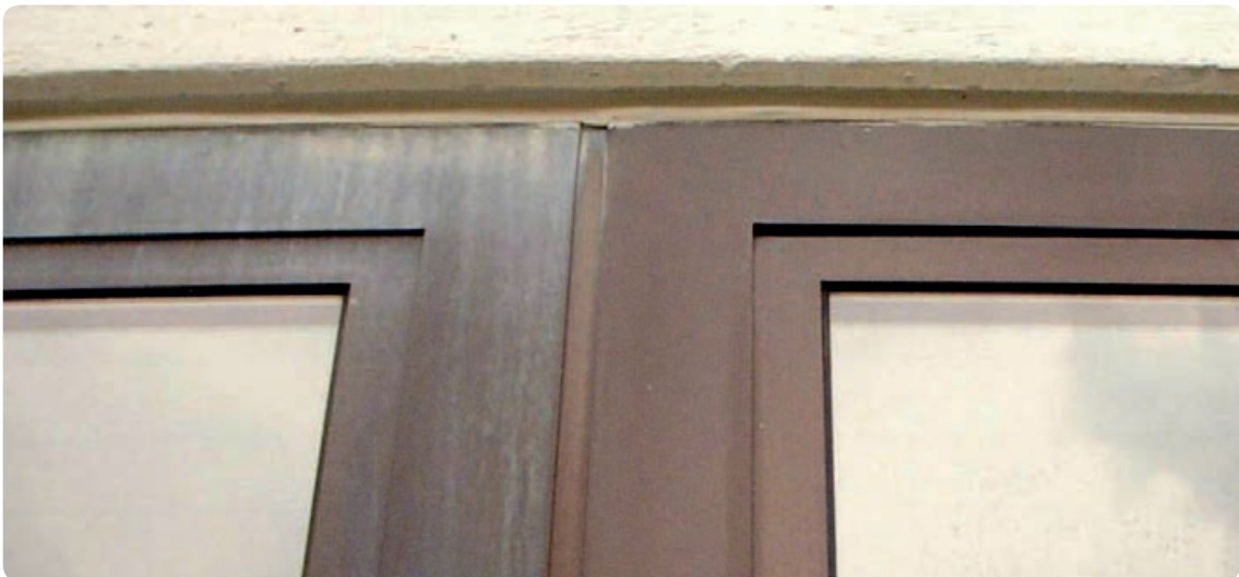
Rapid entfernt Farbe von Regenauswaschung