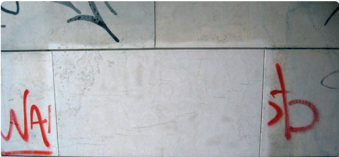
Graffitentfernung und gleichzeitige Reinigung